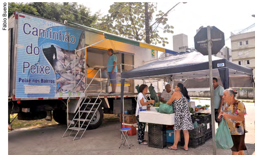
Caminhão do Peixe atende semanalmente em cinco bairros

De segunda (8) a quinta-feira (11), o Caminhão do Peixe de Guarujá percorre os bairros da sede do Município e do Distrito de Vicente de Carvalho oferecendo pescados a preços mais acessíveis. No veículo, a população poderá encontrar sardinha, mistura, corvina, pampo, pescada, espada, camarão, tilápia, bagre, carapeva, gordinho, tainha e galo. No local, também acontece a Feira de Agricultura Familiar com temperos, frutas, legumes e verduras mais em conta.